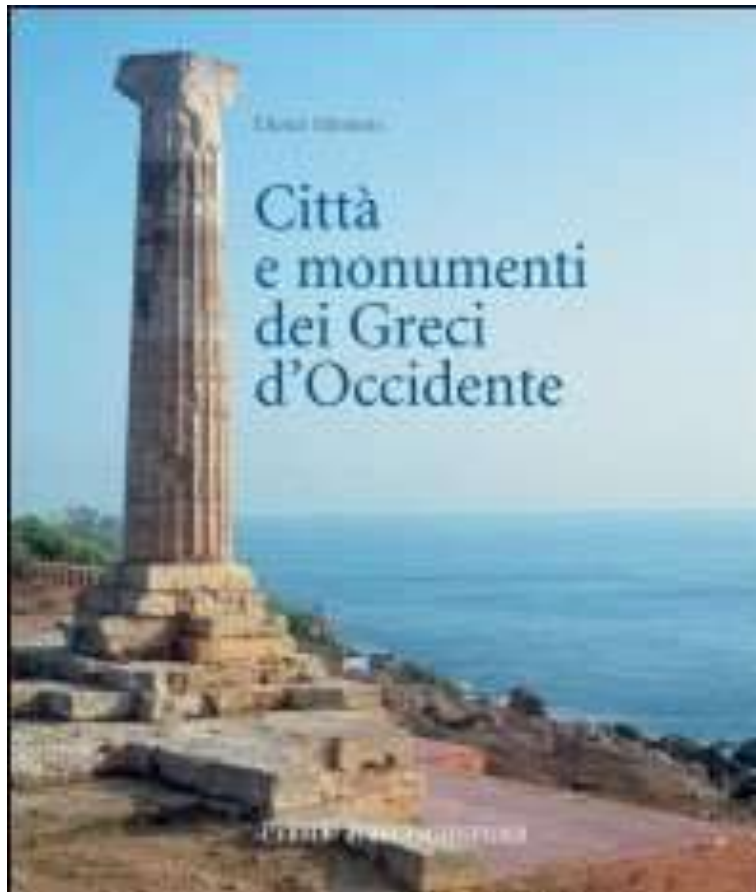
D. Mertens, Città e monumenti dei Greci d'Occidente , L'ERMA di Bretschneider, 2006 https://www.lerma1896.it/dettagli_libro/citta-e-monumenti-dei-greci-doccidente